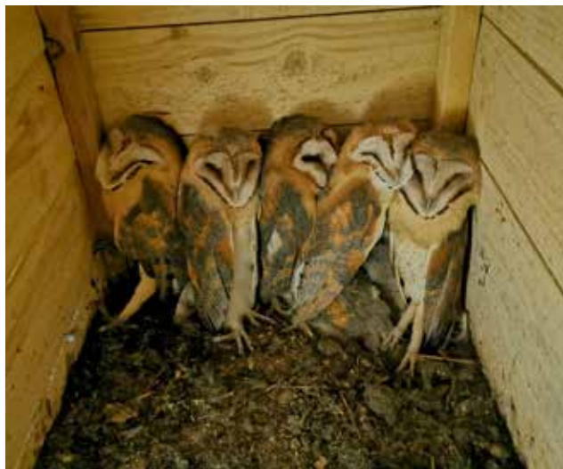
La nichée de Frizon

des choucas des tours. Le couple d'effraies a donné naissance à deux jeunes ; ce n'est qu'en fin de journée qu'elles montrent le bout de leur bec dans l'ouverture du nichoir. Elles ne sortent de leur refuge pour aller chasser qu'à la nuit tombée, il est très rare de les observer dans la journée. Aucun bruissement d'aile ne vous fera lever la tête à leur passage, leur vol est le plus silencieux parmi ceux de tous les rapaces nocturnes. Par contre, si vous en avez près de chez vous, vous pourrez entendre la nuit leurs chuintements faits de « chhhh » de « khrûh » ou « khraikh ».