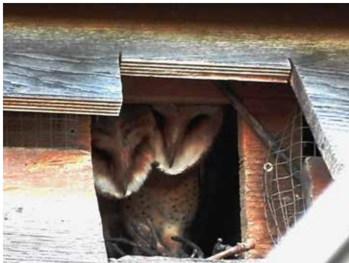
La nichée d'Escles