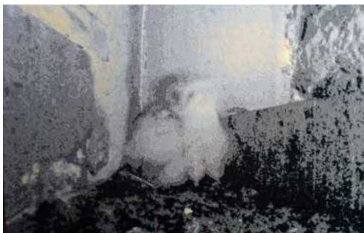
La nichée de Saint-Benoît